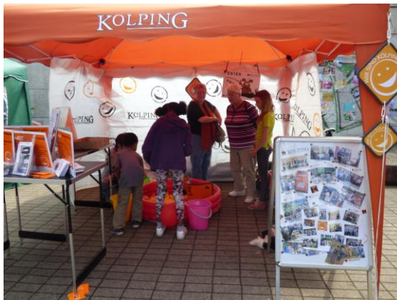
Bilder und Flyer von unserer KF