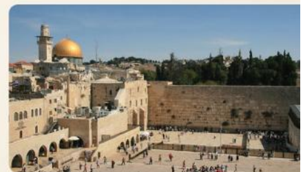
Land und Leute - Biblische Orte, Religion und Politik

Kath. Pfarrgemeinde St. Augustinus Hannover-Ricklingen Familienkreis und Kolpingfamilie Ricklingen