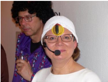
Moderation: „Lachmöwe Gabi“ (Moni ist grad weggeflogen)