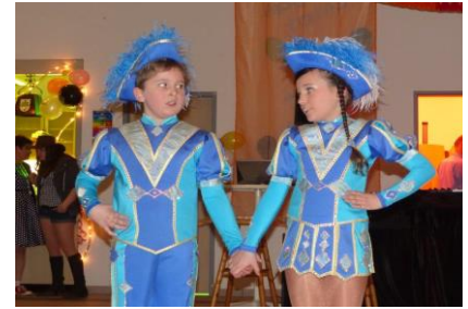
Tanzpaar der Lindener Narren