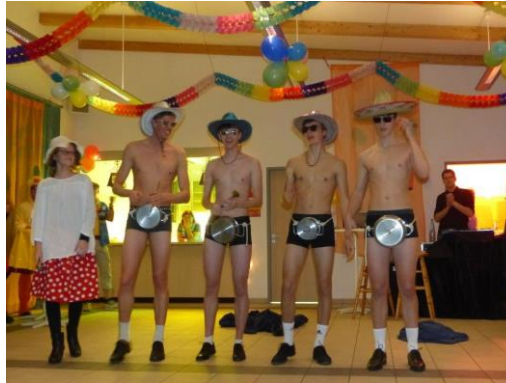
Kolpingjugend „Die Glocken von Rom“