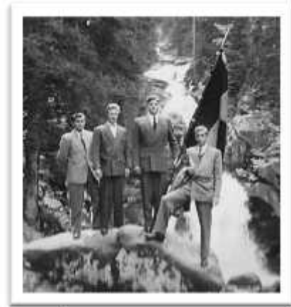
Am Triberger Wasserfall