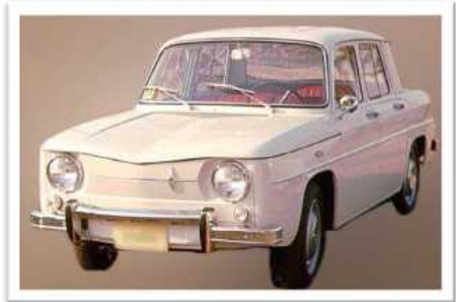
Renault R8 Major