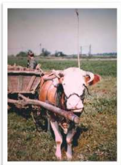
Kuhfuhrwerk im Birkfeld

1983 Ulf Meerbold als erster Deutscher im Weltall. Wirtschaftskrise in Chile, 1/3 unterernährt, 25% arbeitslos.