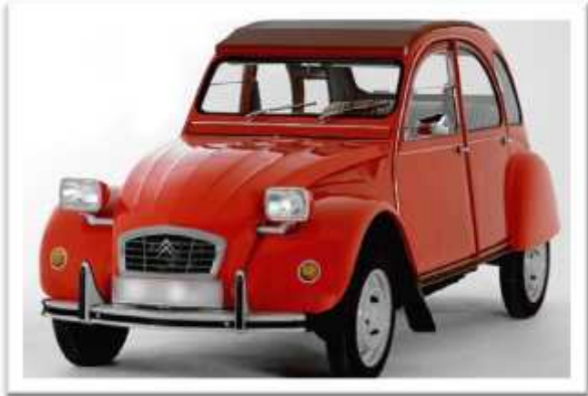
Citroen 2 CV