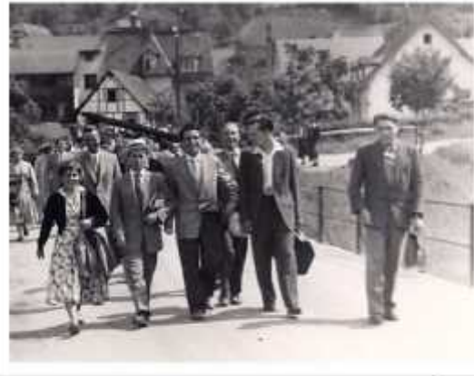
Wer recht in Freuden wandern will ...