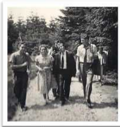
Wandern im Anzug