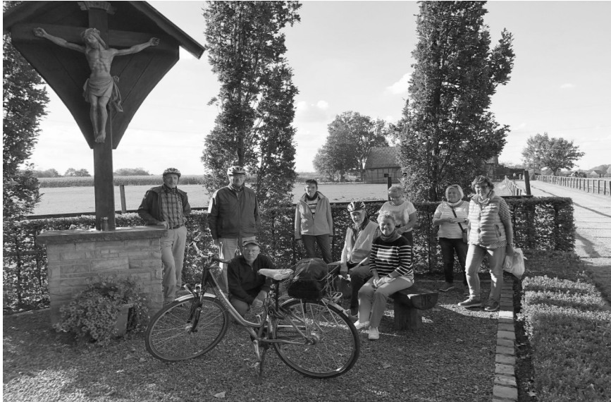
Teilnehmer bei der Radtour am Montag, 7. September 2020