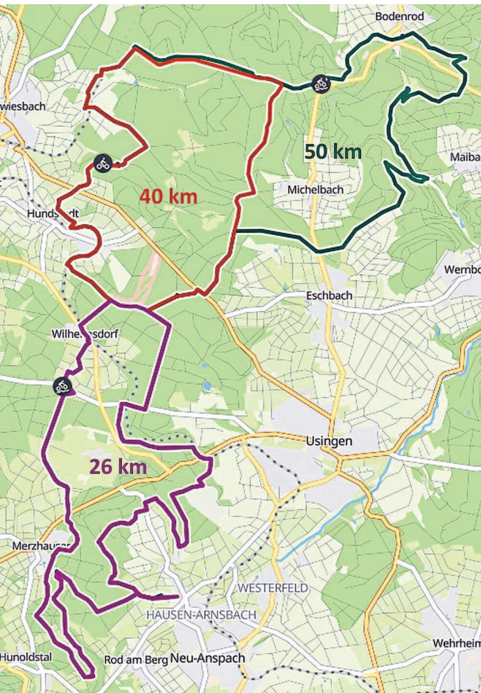
Insgesamt drei Strecken werden bei der Radfahrvereinigung Neu-Anspach angeboten. Es stehen drei Strecken von 26 km, 40 km und 50 km zur Auswahl.

Radfahrvereinigung Neu-Anspach lädt für 24. September ein