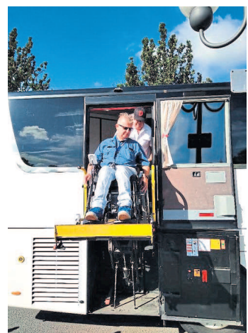
VdK-Bus mit Speziallift für Rollstuhlfahrer beim Einstieg in Neu-Anspach.