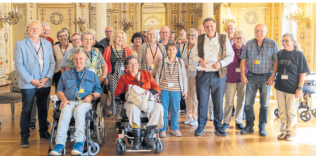
Besuchergruppe des VdK Usinger Land mit MdL Holger Bellino im Landtag.

meinschaft Altweilnau und der Kultur- und Förderkreis Burg Altweilnau e.V. freuen sich über viele interessierte Gäste.