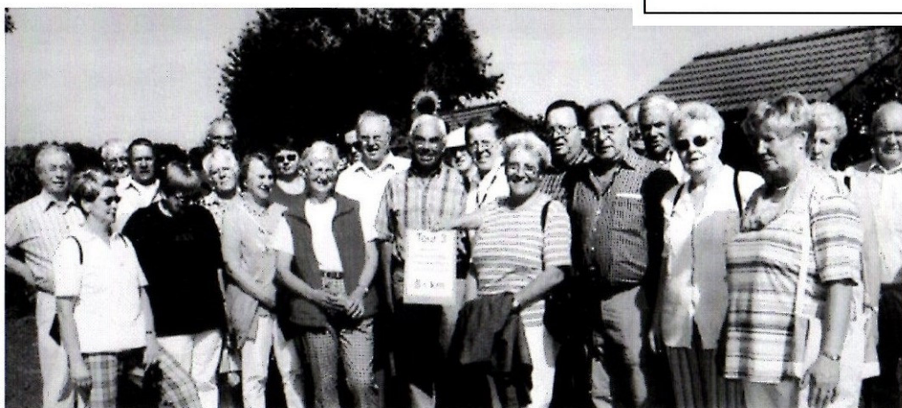
Bild rechts: Diözesan- Wandertag: Der Weg führte unter anderem durch die Kleingarten- anlage Vogelsang in Höntrop.

zum Westfälischen Römermuseum in Haltern (18 Teilnehmer) Mittagspause im Restaurant „Tannenhof“