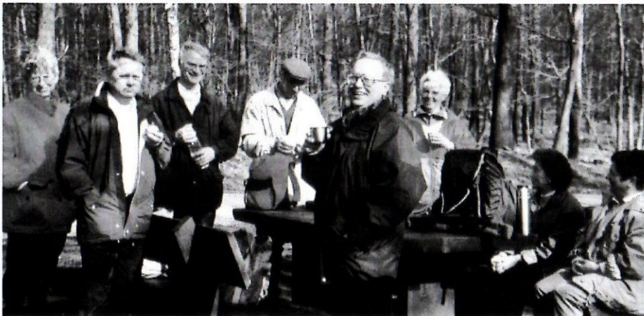
Bild unten rechts: Auf diesem Rastplatz standen sogar Blumen auf dem Tisch. Wohl nicht nur für uns, aber es hat uns sehr gefreut.