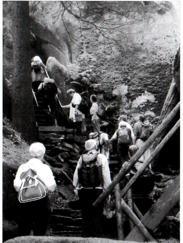
Bild unten rechts: Auf dem Weg zur Gaststätte „Torfmoorhöhle“. Mit vereinten Kräften werden die Schwierigkeiten gemeistert.