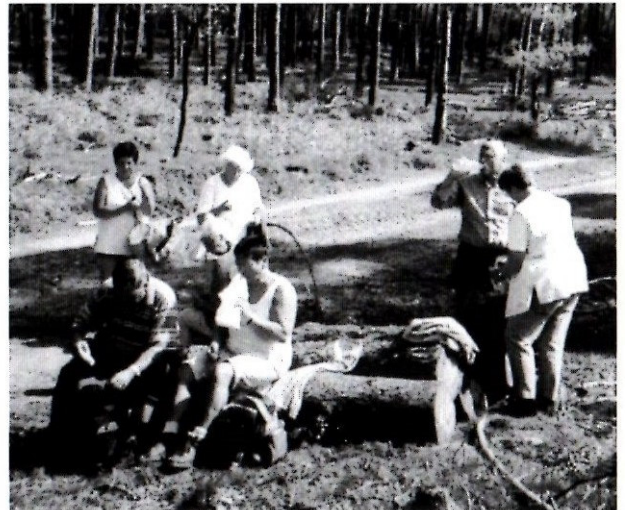
Wanderung bei Deuten am 7. Mai.

Besuch im Bochumer Planetarium im Januar mit 19 Personen