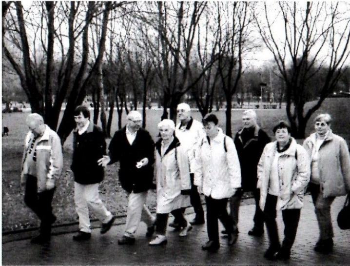
Abschlusswanderung in Herne.

Besuch im Neandertal-Museum in Mettmann am 28. Januar mit 25 Personen.