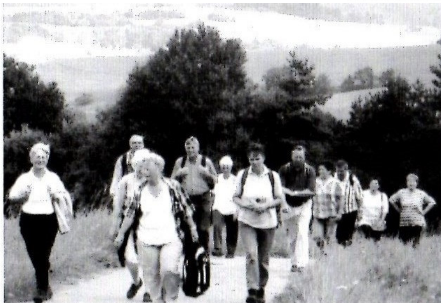
Bild Mitte: Die Wanderwege im Mittelgebirge sind immer sehr „abwechslungsreich“.