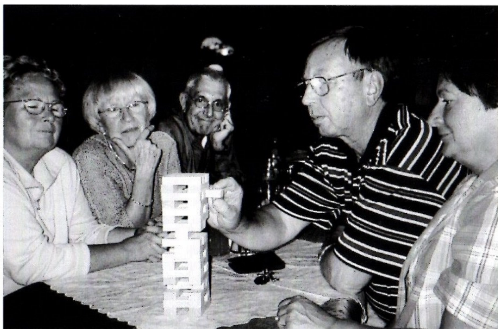
Bild unten: Das Jenga-Spiel am Abend erfordert volle Konzentration nach einem Wandertag im Odenwald.