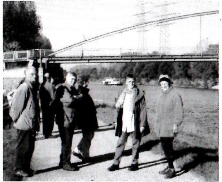
Bild oben: Auf dem Emscherparkweg von Herne zum Gelsenkirchener Zoo, am 17. Oktober.

zum Kloster Saarn in Mülheim (20 Teilnehmer) Mittagspause im Gasthof „Haus Hansen“