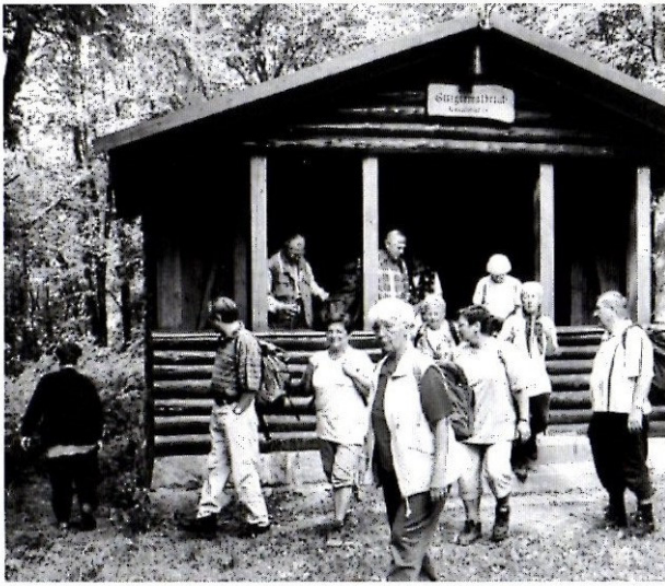
Ein schöner Rastplatz im Steigerwald.