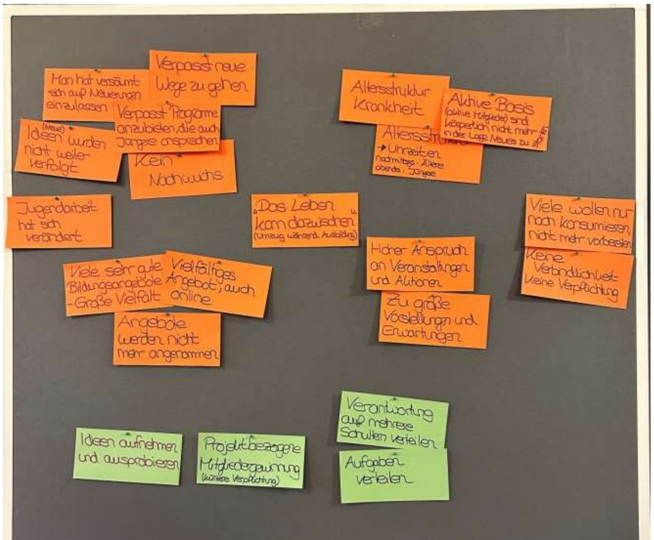
Blockierungen in der KF Plochingen-Wernau