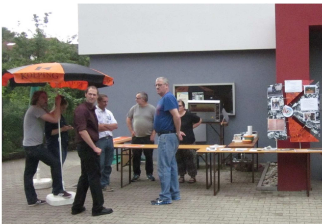
Einweihung des Mehrgenerationenhauses