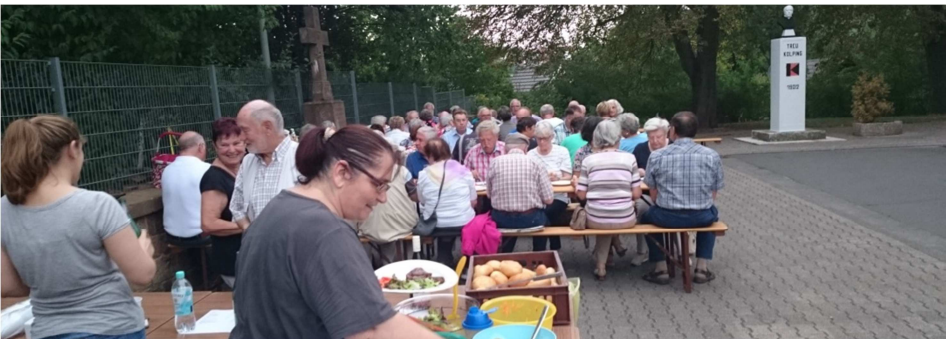
Grillfest Mariä Himmelfahrt