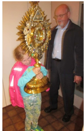
Monstranz St. Michael