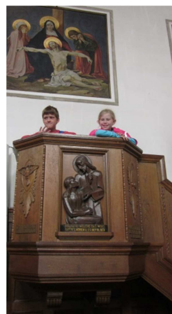
Auf der Kanzel St. Michael