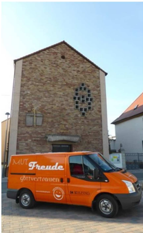
St. Pirmin Godramstein