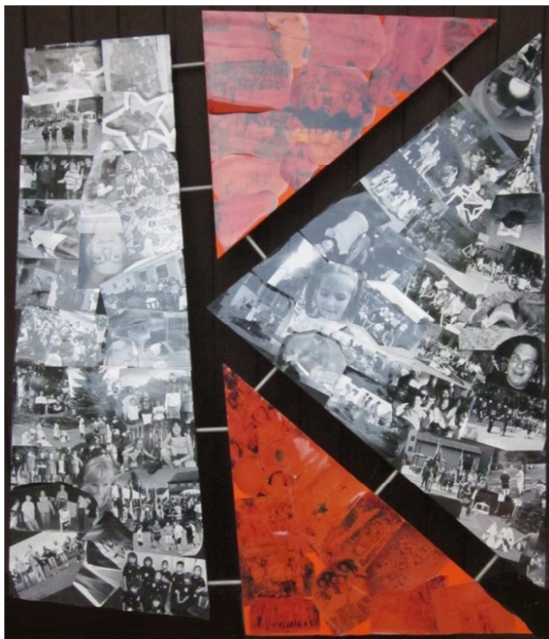
KF Otterbach in Bildern