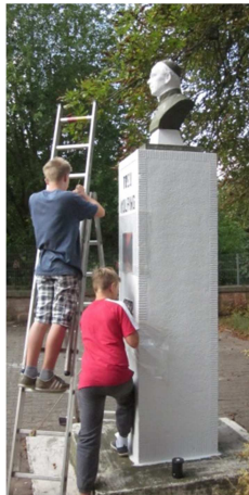
Fast fertig ...