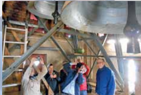
Turmbesteigung St. Martinus Olpe