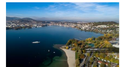
Luzern am Vierwaldstättersee