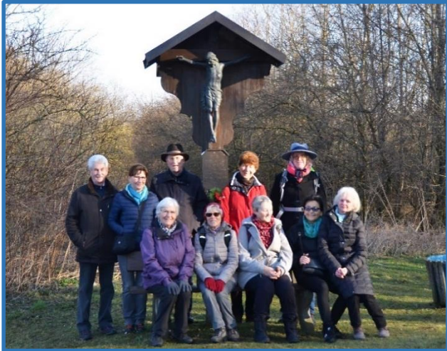
An unserem Wegkreuz