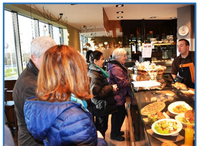
Süßer Abschluss der Wanderung