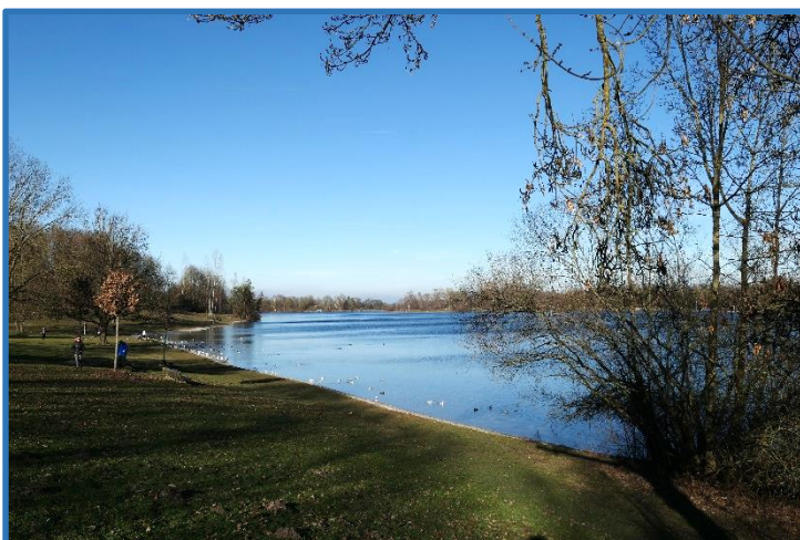
Rund um den Karlsfelder See

Bei herrlichem Wetter fuhren wir mit dem Bus zur Haltestelle Ruderregatta. Von dort aus wanderten wir in westlicher Richtung an der Imkerei Ketzler und später an unserem Wegkreuz vorbei bis zum Kaltenbach. Diesem folgen wir nach Süden, gingen dann durch das Schwarzhölzl und am Moosgraben entlang zum Karlsfelder See. Eine Mittagspause von gut zwei Stunden legten wir im Karlsfelder Seehaus ein. Anschließend gingen wir um den See herum und durch die Wochenendhaussiedlung „Am Tiefen Graben“ nach Dachau. Dort angekommen, hatten wir „Glück im Pech“. Denn der Bus war weg und wir konnten uns beim Rackl noch einen Kaffee und Kuchen gönnen. Zurück ging es dann mit dem Bus nach Oberschleißheim. Es war wieder ein schöner und gemütlicher Ausflug. Wir freuen uns schon jetzt auf die Frühjahrswanderung, die hoffentlich keine Winterwanderung werden wird. Die Gefahr ist gering - sie ist ja erst im Juni!