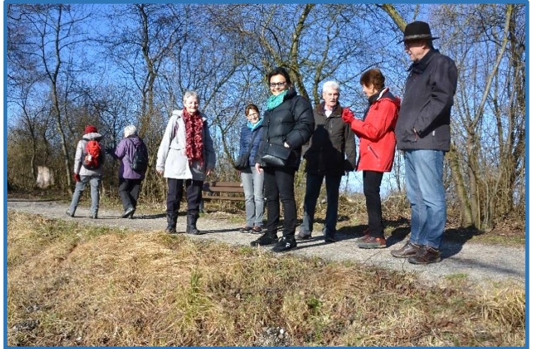
Am „Moosgraben“ entlang