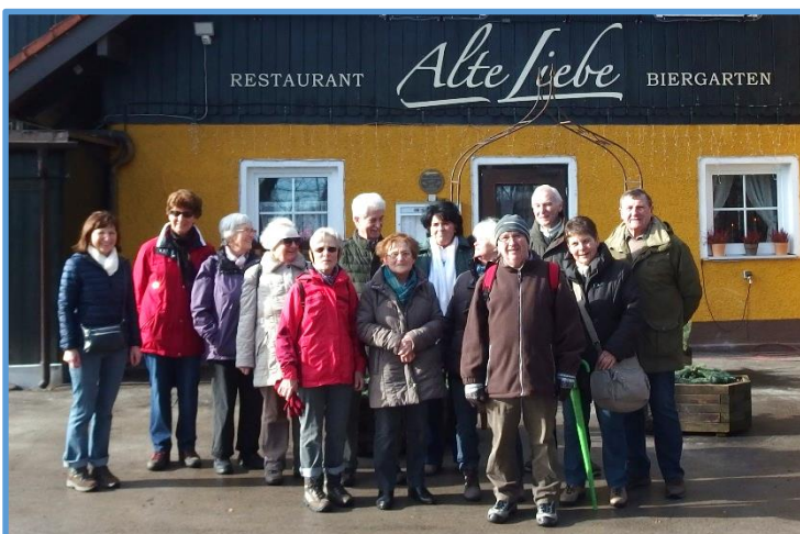
Am Restaurant angekommen

Petrus hat es gut mit uns gemeint! Bei sonnigem Wetter fuhren 15 „Kolpinger“ mit Privatautos nach Dachau zum Parkplatz beim Familienbad. Von dort aus wanderten wir entlang der Amper zum Restaurant „Alte Liebe an der Amper“. Leider lag kein Schnee mehr und die Wege waren matschig und zum Teil auch noch eisig. Dies tat der guten Laune aber keinen Abbruch. Im Restaurant genossen wir das hervorragende Essen und erholten uns von den Anstrengungen der Wanderung. Nach zwei Stunden brachen wir auf, gingen zum Parkplatz zurück und fuhren wieder heim. Es war wieder ein schöner und gemütlicher Ausflug. Wir freuen uns schon jetzt auf die Frühjahrswanderung im Juni.