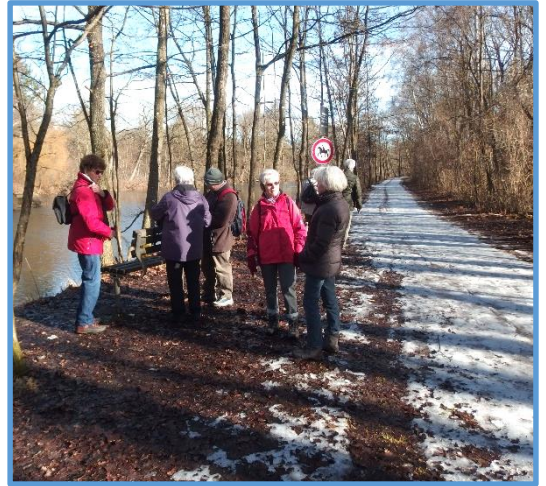
An der Amper entlang

Petrus hat es gut mit uns gemeint! Bei sonnigem Wetter fuhren 15 „Kolpinger“ mit Privatautos nach Dachau zum Parkplatz beim Familienbad. Von dort aus wanderten wir entlang der Amper zum Restaurant „Alte Liebe an der Amper“. Leider lag kein Schnee mehr und die Wege waren matschig und zum Teil auch noch eisig. Dies tat der guten Laune aber keinen Abbruch. Im Restaurant genossen wir das hervorragende Essen und erholten uns von den Anstrengungen der Wanderung. Nach zwei Stunden brachen wir auf, gingen zum Parkplatz zurück und fuhren wieder heim. Es war wieder ein schöner und gemütlicher Ausflug. Wir freuen uns schon jetzt auf die Frühjahrswanderung im Juni.