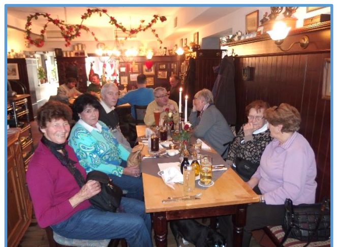
Im gemütlichen Lokal