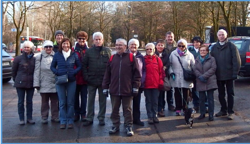
Aufbruch am Parkplatz