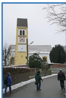
Kirche St. Mariä Himmelfahrt