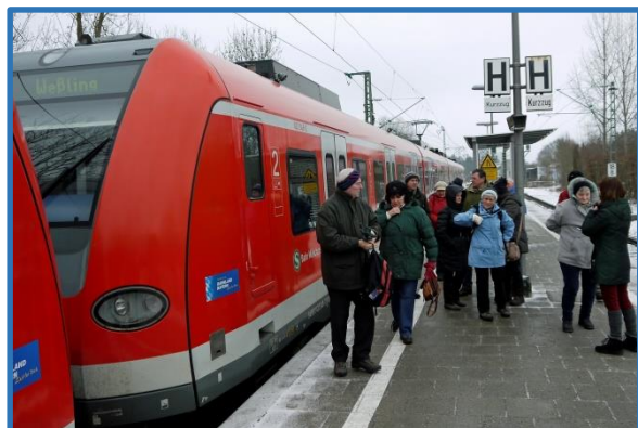
Ankunft in Weßling