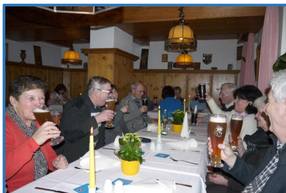
Lohn der Anstrengung