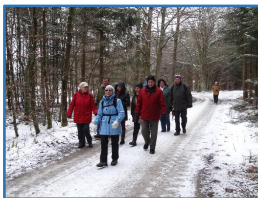
Auf dem Weg nach Auing