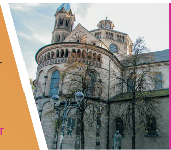
Hot Spot | St. Aposteln »Kirche und Gesellschaft«