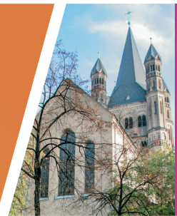
Hot Spot | Groß St. Martin »Ehe, Familie, Lebenswege«

Gemeinsame Sammelaktion: Kolping und die Bürger von Köln spenden gemeinsam 15.000 Paar Schuhe für ein Sozialprojekt