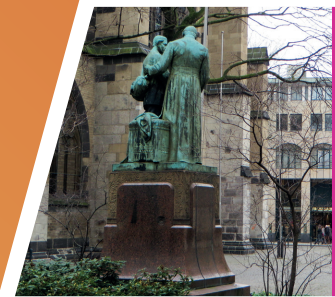
Hot Spot | Kolpingplatz »Eine Welt«