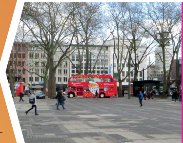
Hot Spot | Neumarkt »Arbeitswelt«