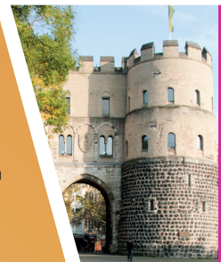
Hot Spot | Rudolfplatz »Junge Menschen«