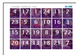
(jeden Tag ein Türchen öffnen)