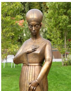
Bild: Klaus Metz (Skulptur)

Ansprechpartner: Ulla Meinberg/ Elisabeth Heering