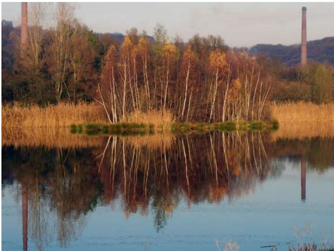
Am Ende des Ruhrtalweges liegt still der Dreieckskanal. In seinem Wasser spiegeln sich Himmel, Bäume, Sträucher und Schornsteine.