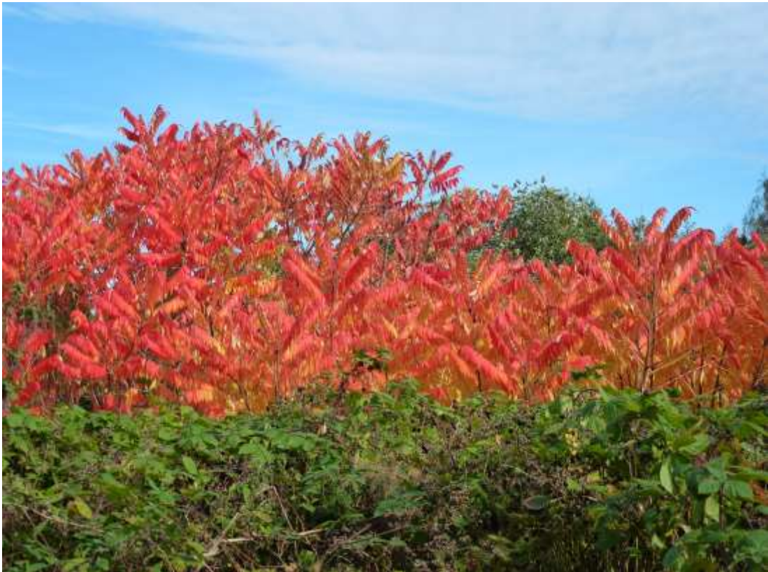
Der Essigbaum leuchtet nicht mehr, er musste einem Hausbau weichen.