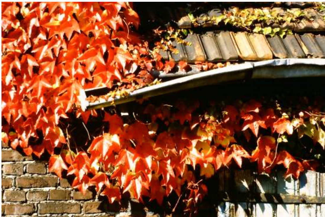
Mit diesem Foto vom Weinlaub vor einer Holztür, Ziegelsteinmauerwerk, verbogener Dachrinne und Dachpfannen. So wie dieses Bild älter ist und nicht mehr geschossen werden kann, vergeht bald die ganze Farbenpracht und macht einem tristen Grau Platz.