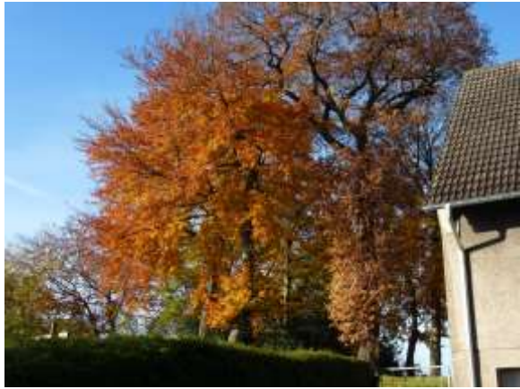
Hier zwei Fotos von der Kirchstraße.