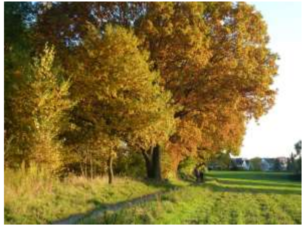
Die Schwalben warten auf den Abflug, und die Eichen am Ruhrtalweg leuchten.