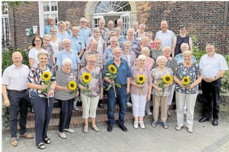
Sonnenblumen sprechen lassen für ehrenamtliches Engagement: Seit 50 Jahren ist der Spiel- und Klönnachmittag der Kolpingfamilie Emsbüren für Senioren ein Dauerbrenner.

50 Jahre Spiel- und Klönnachmittag der Kolpingfamilie Emsbüren