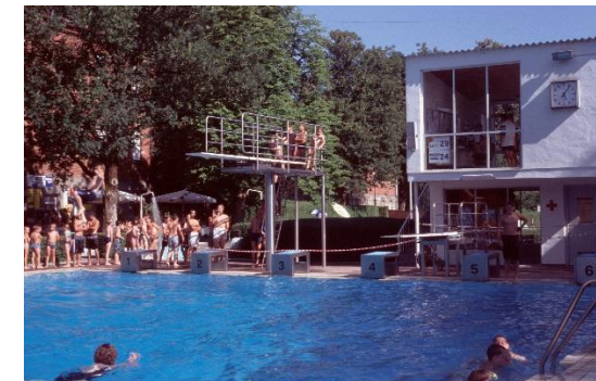
Deggendorfer Freibad, 2003