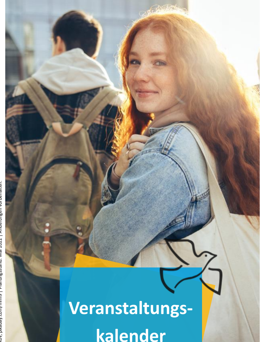
Planungsstand: Mai 2022 | Änderungen vorbehalten.

Herausgeber: Kolpingsfamilie St. Meinolf | Meinolfstr. 1a | 33607 Bielefeld E-Mail: mitgliederservice@kolping-meinolf.de | Homepage: www.kolping-meinolf.de