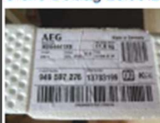
Das Induktionskochfeld wurde wegen Küchenwechsel ausgebaut und sollte noch funktionieren.