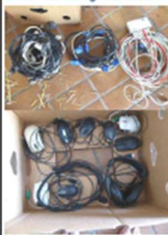
Produkt: Elektronik Gerätebau, kleine, verlegungsstarke Kabelwerke, Sonder-Verbindungsgeräte, Netzwerke, Datenverbindungsgelände, Kopiergeräte, etc.