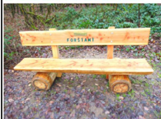
Wo wurde dieses Bild von der Bank mit der Aufschrift

Die Rückmeldung mit den persönlichen Angaben Name und Anschrift werden nur für den Zeitraum vom laufenden Rätsel aufbewahrt, danach vernichtet und bei der Veröffentlichung der Lösung nur nach Einwilligung durch den Gewinner genannt. Nun wünschen wir Ihnen schöne Spaziergänge in der frischen Luft und viel Glück beim Finden.