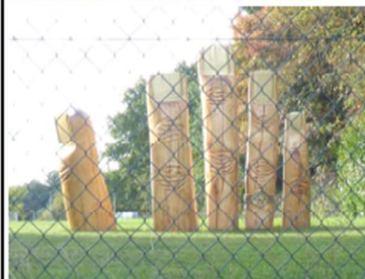
Wo wurde dieses Bild mit den fünf Fingern am 5. Oktober 2021 aufgenommen?

Die Rückmeldung mit den persönlichen Angaben Name und Anschrift werden nur für den Zeitraum vom laufenden Rätsel aufbewahrt, danach vernichtet und bei der Veröffentlichung der Lösung nur nach Einwilligung durch den Gewinner genannt. Nun wünschen wir Ihnen schöne Spaziergänge in der frischen Luft und viel Glück beim Finden.