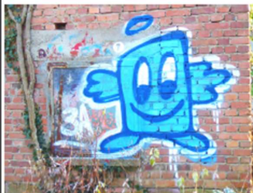
Wo wurde dieses Bild mit dem Graffiti Bild am 22. Dezember 2021 aufgenommen?

Die Rückmeldung mit den persönlichen Angaben Name und Anschrift werden nur für den Zeitraum vom laufenden Rätsel aufbewahrt, danach vernichtet und bei der Veröffentlichung der Lösung nur nach Einwilligung durch den Gewinner genannt. Nun wünschen wir Ihnen schöne Spaziergänge in der frischen Luft und viel Glück beim Finden.