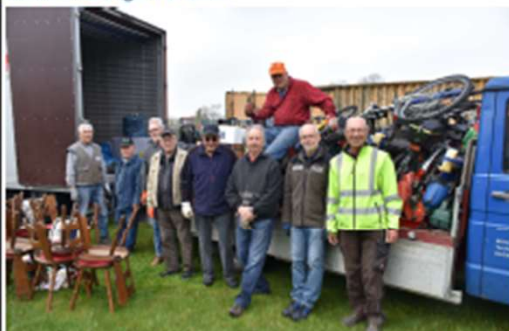
Das bayerische Staatsministerium fördert diesen Transport mit einem Zuschuss.

Nach einer turbulenten Organisation mit der Spedition konnten wir die Kolpingsfamilien Großostheim, Alzenau, Schweinheim in Abstimmung mit dem Kolping Bezirk Aschaffenburg-Alzenau die Verladung wie geplant in Großostheim vornehmen.