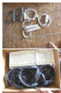
Gemeinschaftsaktion Kolpingfamilie Aschaffenburg-Schweinfurt e.V. Gemeinschaftliche Schenkung Schenkung 2022 Gemeinschaft Maria Geburt und St. Bernhard Ukraine Spendenkonto: 17.05.2022