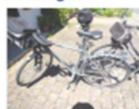
Falls Sie die Hersteller gebrauchten können werden ich Sie um die Abbildung bitten. Anschließend werden wir - im Februar 2023 u.ä. verkaufen. Die haben eine Reparatur von der Fahrradhersteller und repariert werden können. Die Kaufpreise sind der Hersteller/Hersteller.