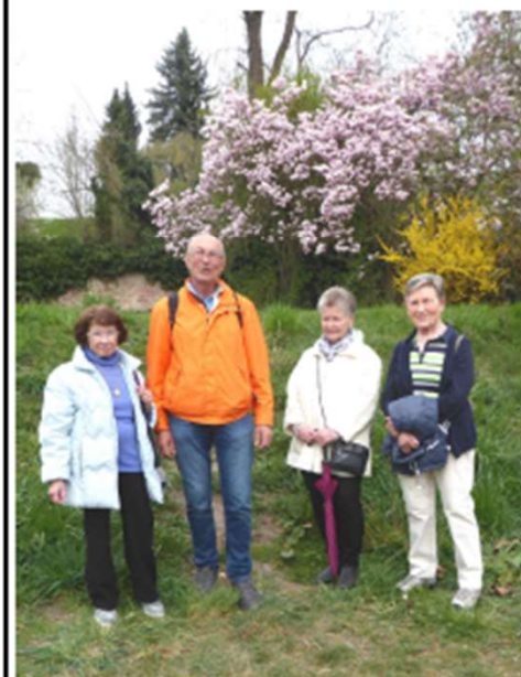
Die Einkehr am Mainufer war gut möglich!

Am Dienstag hatten wir noch einen guten Tag erwünscht. Auch wenn die Sonne nur kurzzeitig sichtbar war, war die Temperatur doch relativ angenehm. Auf der kurzen Strecke war das blühende Angebot an Blumen, Sträucher und Bäume sehenswert.