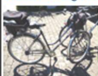
Kleines, dunkelblaues Fahrrad Es hat eine gute Die Schaltung ist einstellbar gefügt oder ersetzt werden Die Beschichtung ist einstellbar bei einem Hersteller/Hersteller, das ist möglich.