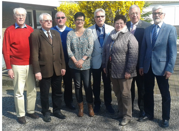
Der Vorstand unseres Bezirksverbandes am 18.04.2015

Der Versammlung ist bewusst, dass es in den nächsten Jahren erheblicher Veränderungen geben wird, weil die KF überaltert und ohne Nachwuchs sind. Deshalb gehen die Diskussionen weiter, um den verbliebenen Mitgliedern weiterhin eine Kolping- Heimat anzubieten, in welcher Form auch immer.